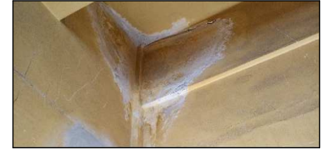
ACCESO TORRE NIVEL 4TO PISO EDIFICIO