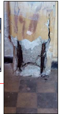
PRIMER PISO TORRE